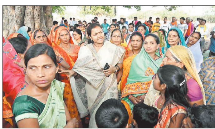
महिलाओं से रूबरू होकर समस्या सुनती मंत्री।