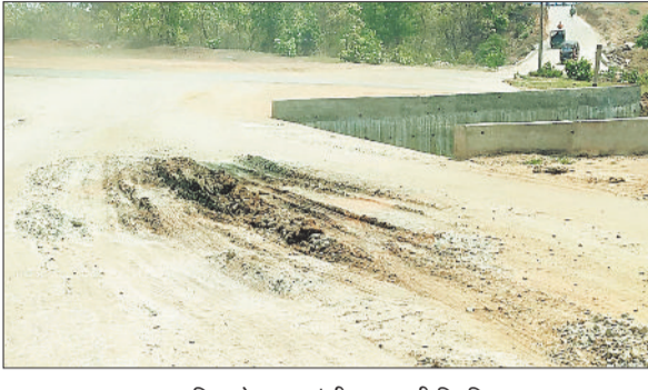
छठघाट पुलिया के ऊपर धंसी सड़क की स्थिति।

वर्तमान में लोग चरचा थाना के समीप वाले मार्ग से होकर छठ घाट के रास्ते चरचा कॉलेजी तक पहुंच रहे हैं, किंतु छठ घाट पुलिया के ऊपर की सड़क की मिट्टी धंस जाने से यह मार्ग बेहद खतरनाक हो गया है। विशेष रूप से दो पहिया वाहनों के लिए यह स्थान दुर्घटना संभावित बन गया है। वाहन चालकों को इस जगह पर बेहद सतर्कता बरतनी पड़ रही है। गौरतलब है कि जब तक रेलवे अंडरब्रिज मार्ग पुनः शुरू नहीं होता, तब तक इसी वैकल्पिक मार्ग का उपयोग किया जाएगा। इसलिए बरसात के पूर्व ही छठ घाट पुलिया के ऊपर धंसे हिस्से की मरम्मत अति आवश्यक है, ताकि वर्षा काल में मार्ग पूरी तरह जर्जर न हो जाए