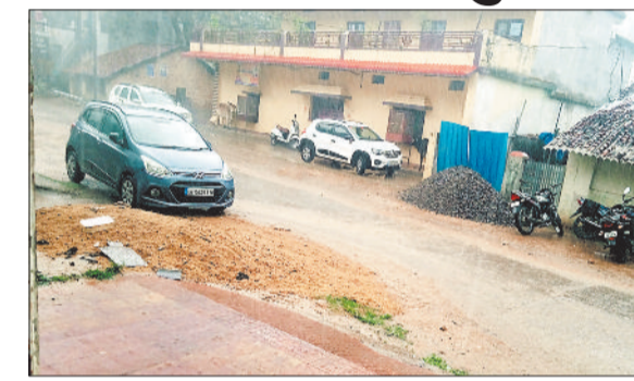
आज से बढ़ेगा तापमान: जिले में एक सप्ताह से अधिक समय तक मौसम में आए बदलाव के कारण बदली बारिश का मौसम बना रहा।

बार फिर सोमवार की शाम के समय शहर को भिगोया। कुछ देर तक चली बेमौसम बारिश से सड़कों पर आवागमन थम गया।